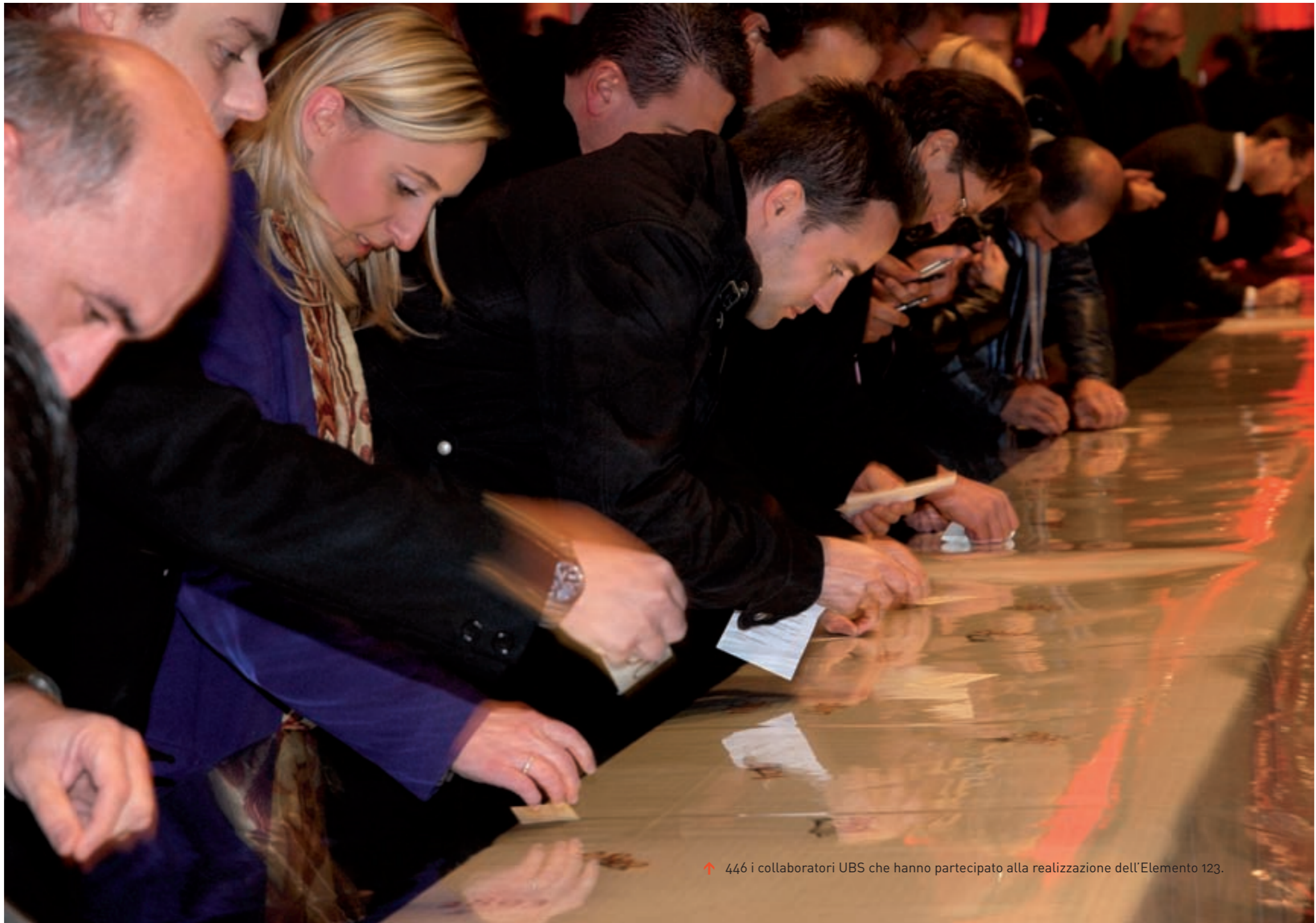
↑ 446 i collaboratori UBS che hanno partecipato alla realizzazione dell'Elemento 123.